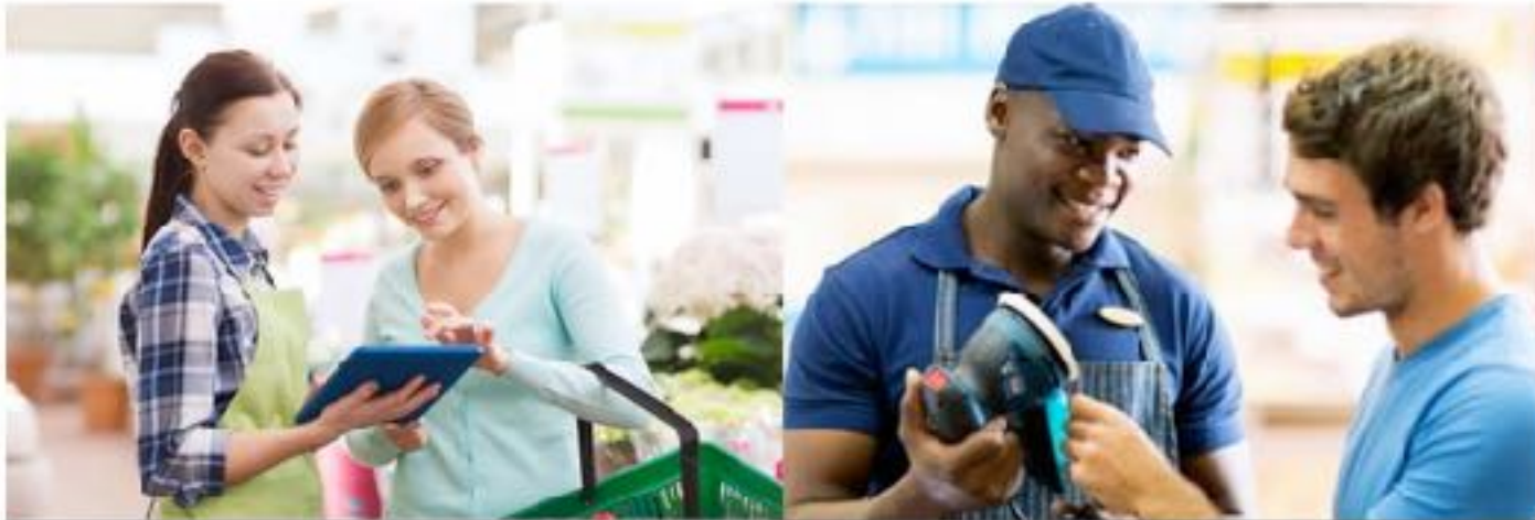
EQUIPIER POLYVALENT DU COMMERCE